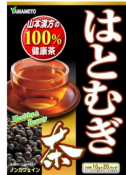
「山本漢方海外旗艦店」での取り扱い商品（一部）

インアゴラは、今後もより多くの日本商品を中国のお客様に紹介し、日本の商品とライフスタイルを楽しんでいただく場をお届けします。