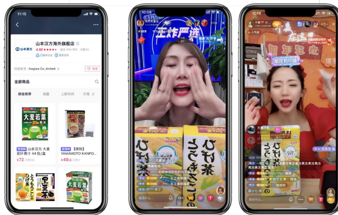
「山本漢方海外旗艦店」ページイメージと抖音ライブの様子

インアゴラでは、2021年4月より、日本企業初の売り場型越境 EC 旗艦店(複数の商品カテゴリーに渡って、多数のブランドを取り扱う総合型店舗)として、「中国版 Tiktok (抖音)」にて越境 EC 旗艦店を出店し、日本商品の販売を正式に開始いたしました。旗艦店開設と同時に、自社の常設店舗型ライブルームで行っている毎日のライブ配信や、KOL と連携した定期的なライブ配信など、「中国版 Tiktok (抖音)」でのライブコマースノウハウを蓄積してまいりました。一方で、日本ブランドが、「中国版 Tiktok (抖音)」において店舗開設するためには、商品紹介に適した KOL の選定や商品選定、動画やライブを用いた手法で訴求するといった他の EC プラットフォームと異なるオペレーションが必要となります。「中国版 Tiktok (抖音)」でのオペレーションの最前線に立っているインアゴラは、自社の旗艦店による多数の日本商品の販売ノウハウや販促ノウハウを活かして、2021年12月より、ブランド旗艦店の運営サポート事業も立ち上げ、日本ブランドの「中国版 Tiktok (抖音)」での旗艦店運営を全面的にサポートしています。