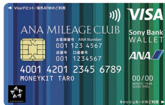
ANAマイレージクラブ / Sony Bank WALLET

今後、100万枚達成を記念したキャンペーンを実施する予定です。詳細が決まり次第、ご案内いたします。