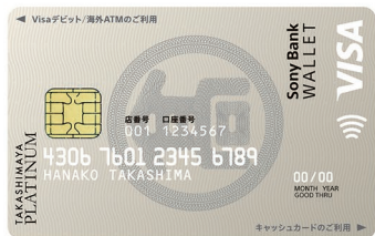
タカシマヤプラチナデビットカード