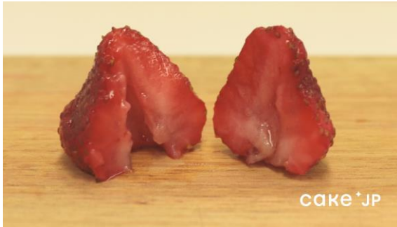
特許取得技術で製造した冷凍イチゴ（解凍10分後）