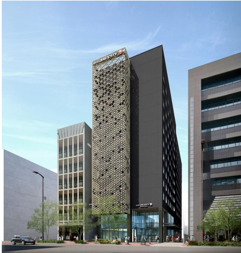
【『ホテル JAL シティ福岡 天神』完成予想図】

株式会社ホテルオークラの子会社でホテル運営会社である株式会社オークラ ニッコー ホテルマネジメント（本社：東京都港区、代表取締役社長：荻田 敏宏）は、2020 年 8 月 7 日付で、福岡天神ホテルマネジメント合同会社（所在地：東京都千代田区）をホテル経営会社として、『ホテル JAL シティ福岡 天神』（2021 年春の開業に向けて、現在、積水ハウス株式会社が開発を行っております）に関する運営管理業務を開始いたしました。