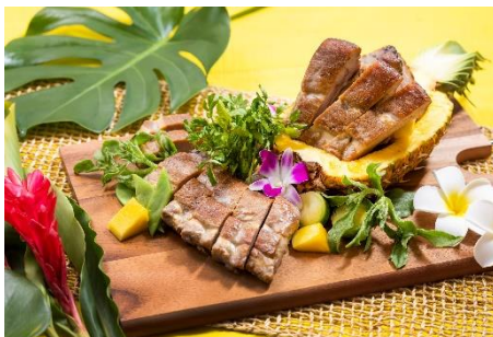
ハワイアンスペアリブ