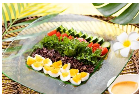
ケールとアサイーのコブサラダ

また、ブッフェに合わせて提供されるハワイアンドリンクがフェアをより一層盛り上げます。（※ブッフェ料金とは別になります）