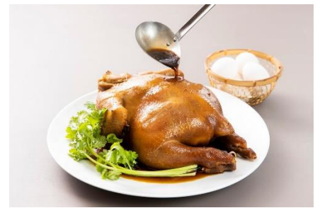
鶏の中華風醤油煮込み

干しエビ、エシャロット、香草とレンコンを練り込んだ豚バラミンチ肉を焼き、オイスターソースと一緒に楽しむ「レンコン餅」や、豪快に蒸し上げた鯛に、甘辛く味付けした豚細切り肉と干しいたけをのせ、香り豊かな香草や長ネギを添えた、香港流のおもてなしメニュー「鯛の中華蒸し」。骨付きのラム肉を広東特産の香味みそ、柱候醬のペーストなどとともに煮込んだ、身心ともに温まる伝統的な料理「特製羊肉の蒸し焼き鍋」。さらに、キャベツ、イチジク、ニンジンなどの新鮮な食材とポークリブを長時間じっくり煮込んだ「ポークスープ」など、滋味深い料理をご用意いたしました。また、1月20日（金）～2月2日（木）の期間限定で、旧正月のお祝いとして、「鶏の中華風醤油煮込み」が登場いたします。