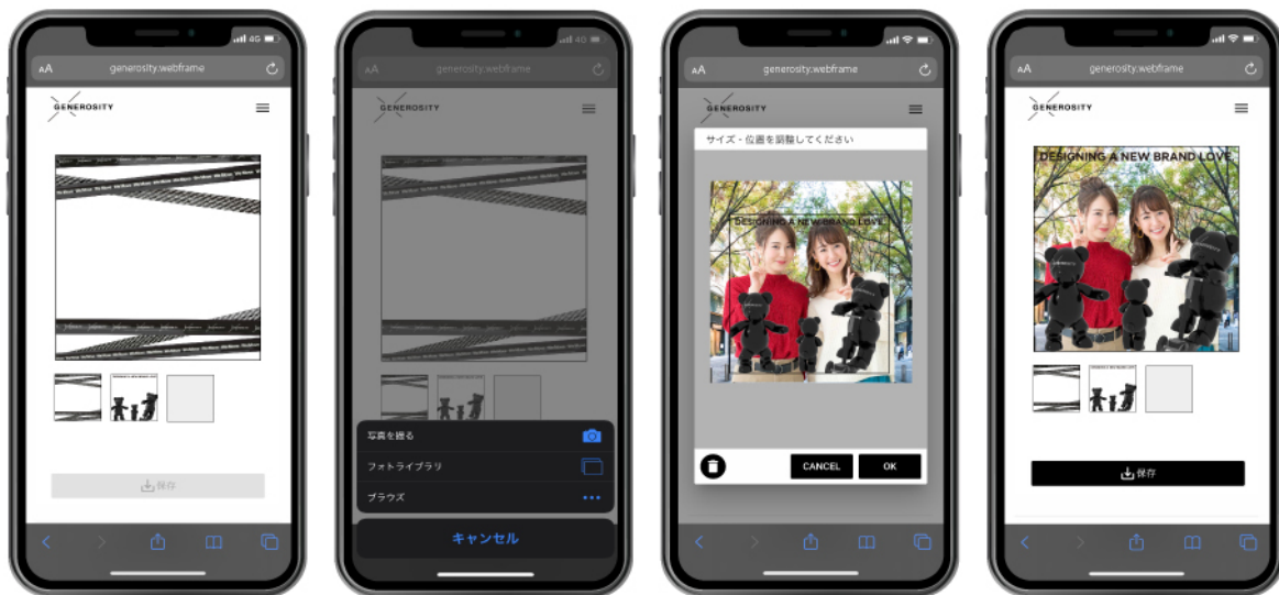
STEP 1 フレームを選択する