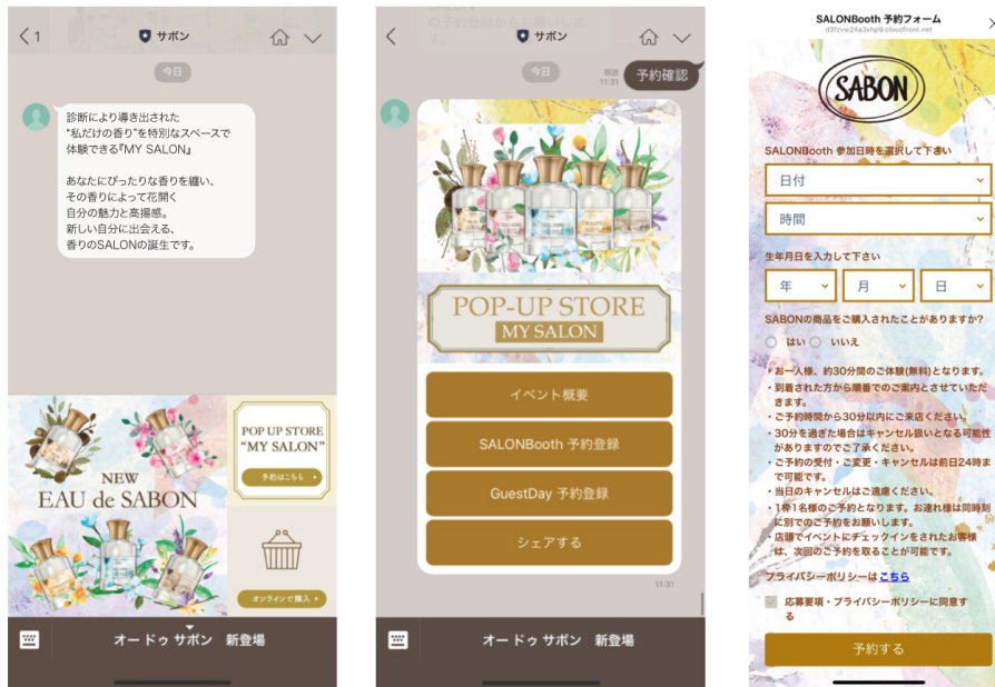
SALON Booth / Guest Day 抽選予約画面

WeCALL 上で予約、予約日時の変更、予約のキャンセル、受付後の再予約も可能です。