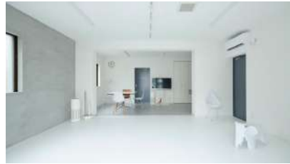
ホスト: CREEMM前野さん エリア: 神奈川県横浜市 高田駅 https://www.spacemarket.com/spaces/creemm_com/rooms/bE67lbuMaXA0Oa9U/