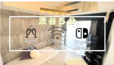
ホスト: AnySpace KOBAYASHIさん エリア: 東京都渋谷区 神泉駅 https://www.spacemarket.com/spaces/dqtbfc6b0-cwwwu9/rooms/Sy3TmjmsCnhlgayDk/

2022年に利用が伸びた「推し会」や「ママ会」向けのパーティースペースが人気となりました。行動制限緩和により、パーティー利用は今後も増えていくと予測されます。