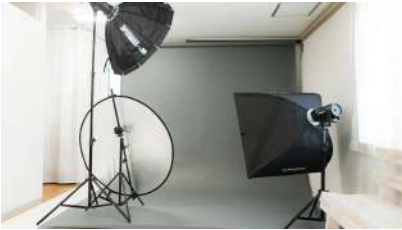
ホスト: ゲットマーケット開発さん エリア: 福岡県福岡市 吉塚駅 https://www.spacemarket.com/spaces/r2bfh1rmtzehawcz/rooms/5vLUgMki8Z7G54zX