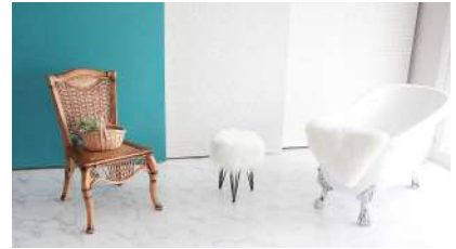
ホスト: ラウンドプレスさん エリア: 東京都豊島区 池袋駅 https://www.spacemarket.com/spaces/alu-photostudio/rooms/KMvjiuDZ4LzRnb29/