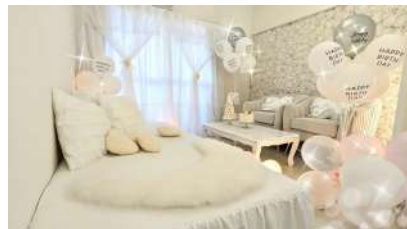
ホスト: Partycoco 大橋なおみさん エリア: 愛知県名古屋市 名古屋駅 https://www.spacemarket.com/spaces/partycoco-numa/rooms/rFux3RTm50ms_3hv