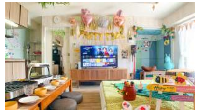
ホスト: AGURAエンターテイメントさん エリア: 東京都渋谷区 渋谷駅 https://www.spacemarket.com/spaces/agura_hands/rooms/StmP-BOz4eM-5RJZ