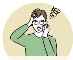
トラブル発生! まずは下記へお電話を。

本サービスは、定額のサービス利用料金をお支払いいただくことで、ホームサーブが選定した身元や実績の確かな修理業者の手配から、通常の修理費用の支払いまでのお客さまの負担を一気通貫でカバーする、いわゆる「サブスクサービス」です。ご自宅の設備故障への見積もり、修理業者の選定等に対するお客さまの不安を、本サービスが解消します。