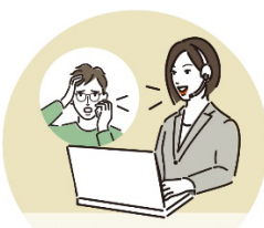
専任オペレーターが 修理業者を手配します!