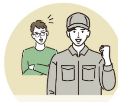
地元の修理作業員が ご自宅へ伺います!