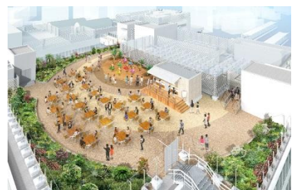
屋上広場イメージ

南に江の島やえぼし岩、西に富士山が望むことができる屋上広場を設け、シーサイドの風を感じながらゆったりと過ごしていただけるスペースです。