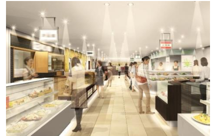
1階食料品フロアイメージ

2階は、グロサリー・ドラッグストアなどを集積し、22時まで営業します。駅直結の利便性に加え、営業時間の拡大で上質な日々の生活をサポートします。