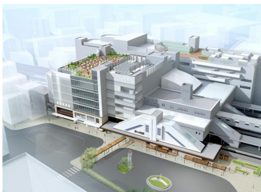
外観イメージ（南口側）

また、湘南地区初進出が27店舗あり、ラスカ茅ヶ崎でのショッピングや飲食を通して、より豊かな茅ヶ崎ライフを楽しんでいただけます。