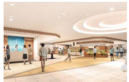
3階ショップエリアイメージ

様々なイベントやワークショップを展開する地域のコミュニティスペースです。湘南・茅ヶ崎の魅力を発信、お客さまに「いつも楽しい変化」をご提供し、茅ヶ崎ならではのイベントを体験していただけます。