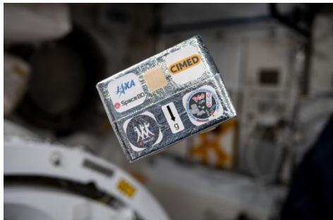
ISS に運ばれた低温高品質タンパク質 結晶生成実験サンプル(イメージ)