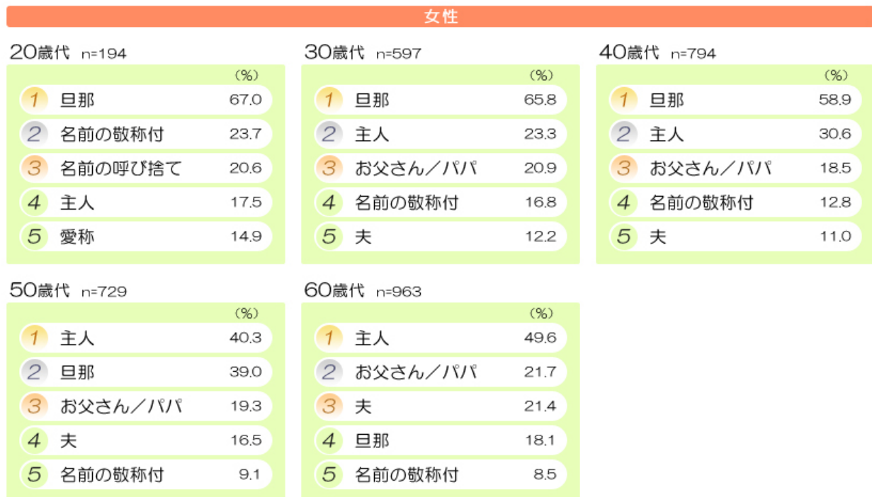
図表3 女性は(親しい人の前で)配偶者をこう呼んでいる(複数回答)