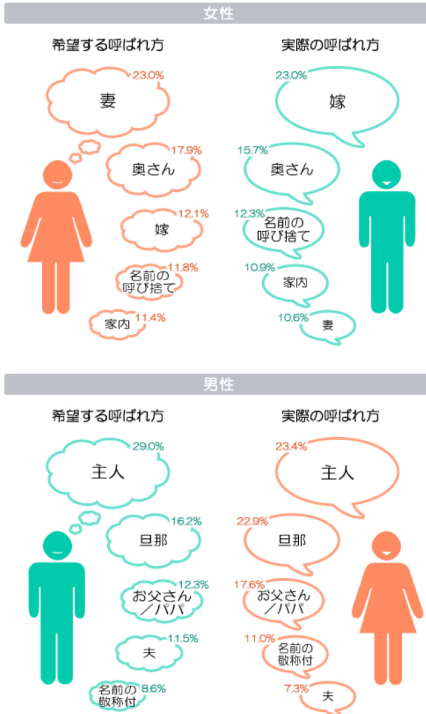
図表1 「実際の呼ばれ方」と「希望する呼ばれ方」(複数回答)

調査時点で配偶者がいる女性に、「親しい人の前で配偶者が自身のことを何と呼ぶか」を聞いたところ、「嫁」が最も多く(23.0%)、次いで「奥さん」(15.7%)でした。 一方、「どのように呼んでほしいか」を確認すると、「妻」がトップで(23.0%)、次いで「奥さん」(17.9%)、「嫁」は(12.1%)となっており、「実際の呼ばれ方」と「希望する呼ばれ方」にギャップがあることが分かりました。 なお、男性については、「実際の呼ばれ方」は「主人」と「旦那」がほぼ同率ですが、「希望する呼ばれ方」では「主人」の割合が大きくなっています(図表1)。