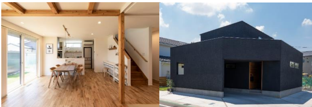
「1階でなんでもできる子育てしやすい家」