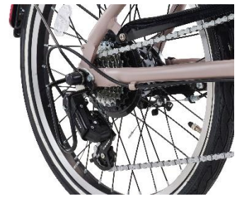
小径でもしっかり走る7段変速