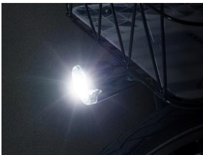
夜道も安心な常時点灯ライトを標準装備