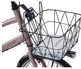
デザインバスケット