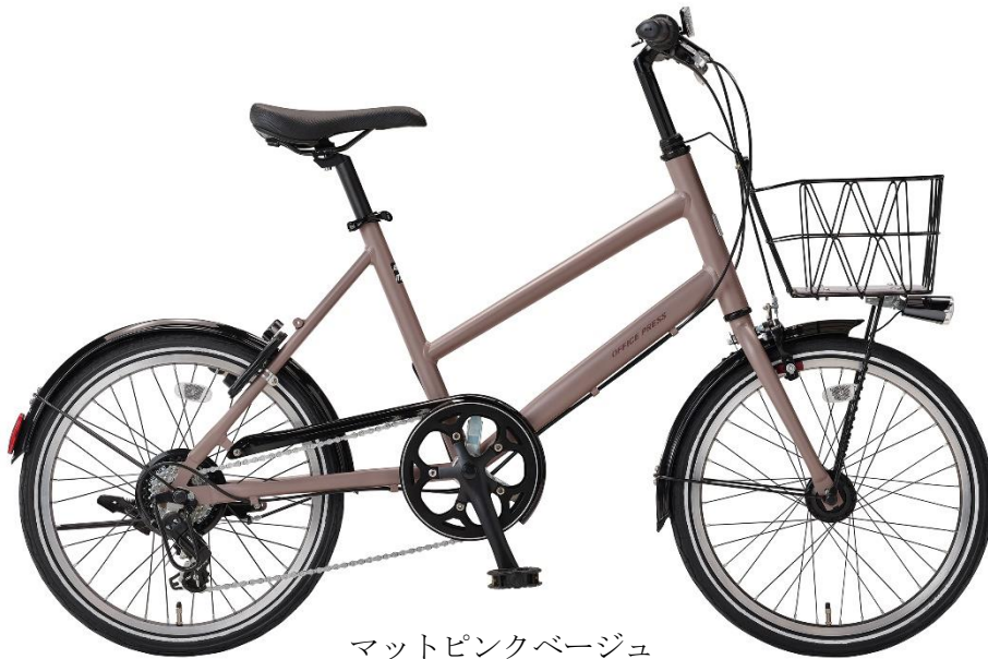
マットピンクベージュ