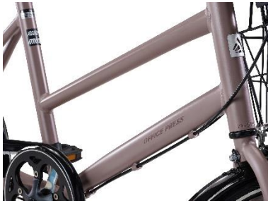
コンパクト&軽量なアルミフレーム