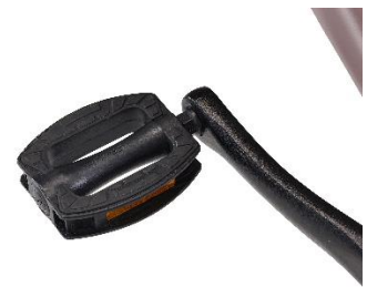
革靴やパンプスでも滑りにくいノンスリップペダル