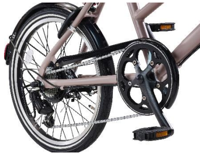
裾汚れも安心のチェーンカバー