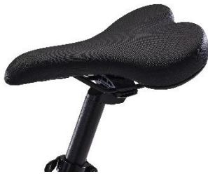
乗り心地の良いスリムサドル