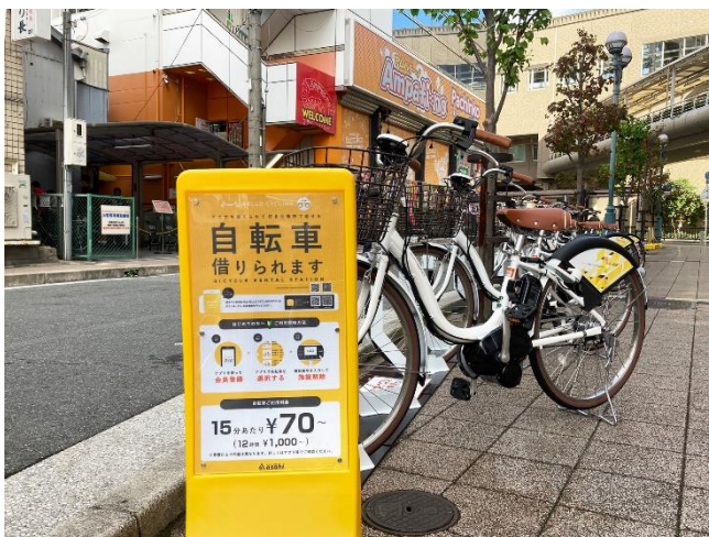
シェアサイクル・ポート（エトレ豊中）

豊中市では、まちの活性化及び健康増進等の効果が期待され、また公共交通網の弱い東西への移動を補強する役割を期待し、あさひが運営するシェアサイクル「HELLO CYCLING（ハローサイクリング）」を導入する実証実験を2019年11月1日より実施しています。