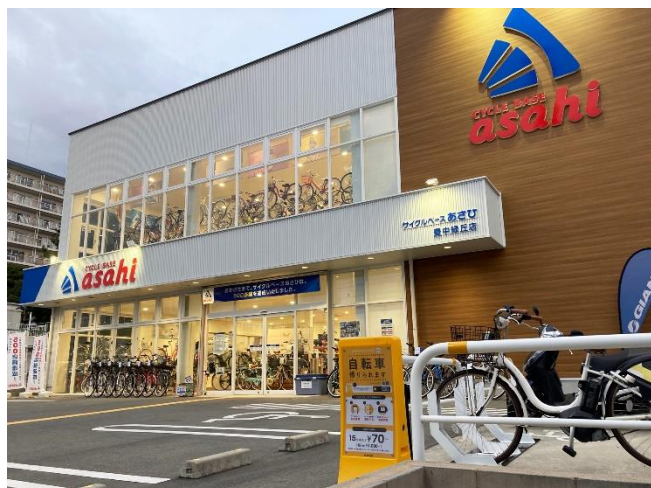
シェアサイクル・ポート（あさひ緑ヶ丘店）

当社は、2021年7月に同市と締結した「自転車活用推進協定」に基づき、脱炭素社会の実現や市民の健康づくりのために、シェアサイクルの普及など自転車活用の推進に協働して取り組んでいきます。