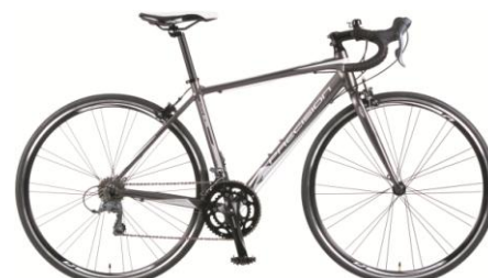
フロストガンメタリック