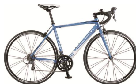
ミディアムブルー