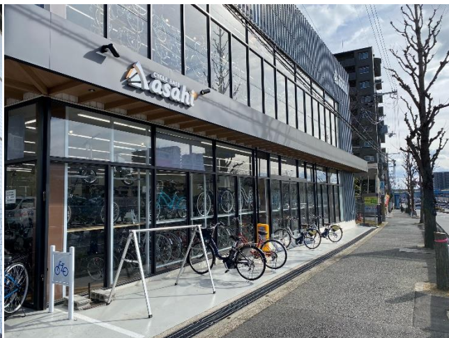
シェアサイクル・ポート【千里中央店】

吹田市においては、市内外の移動および東西における市内各駅間の相互移動を始めとした交通利便性向上とシェアサイクル事業の有効性を明らかにすることを目的として、あさひが運営するシェアサイクル「HELLO CYCLING（ハローサイクリング）」を導入することになりました。