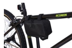
小物収納に便利なフレームバックが付属。車体から取り外しミニバックとしても使用可能。