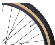
タイヤは機動性に優れた 24 インチ径、乗り心地のよいため 1.95 インチ幅のものを採用。