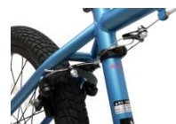
競技用 BMX でも使われる U ブレーキを採用し、本格的なルックスを追求。