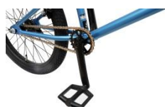
3 ピースクランクを採用し、メンテナンス性をアップ。