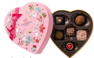
2020年ゴディババレンタインコレクション 「チョコレートクロニクル スウィートコレクション」 ※商品は一例です

「GODIVA 日本上陸48周年 キャンペーン」は、“感謝”や“特別な時間”をテーマにした、ゴディバ商品ご購入者様、ATELIER de GODIVAご利用者様限定イベントです。関西4会場に登場するNMB48には、感謝を伝える時のプレゼントにチョコレートを選ぶメンバーも多く、「特別感がある」「本格感がある」「種類が多くて食べるのが楽しい」「パッケージがかわいい」と、ゴディバのチョコレートが大好き。