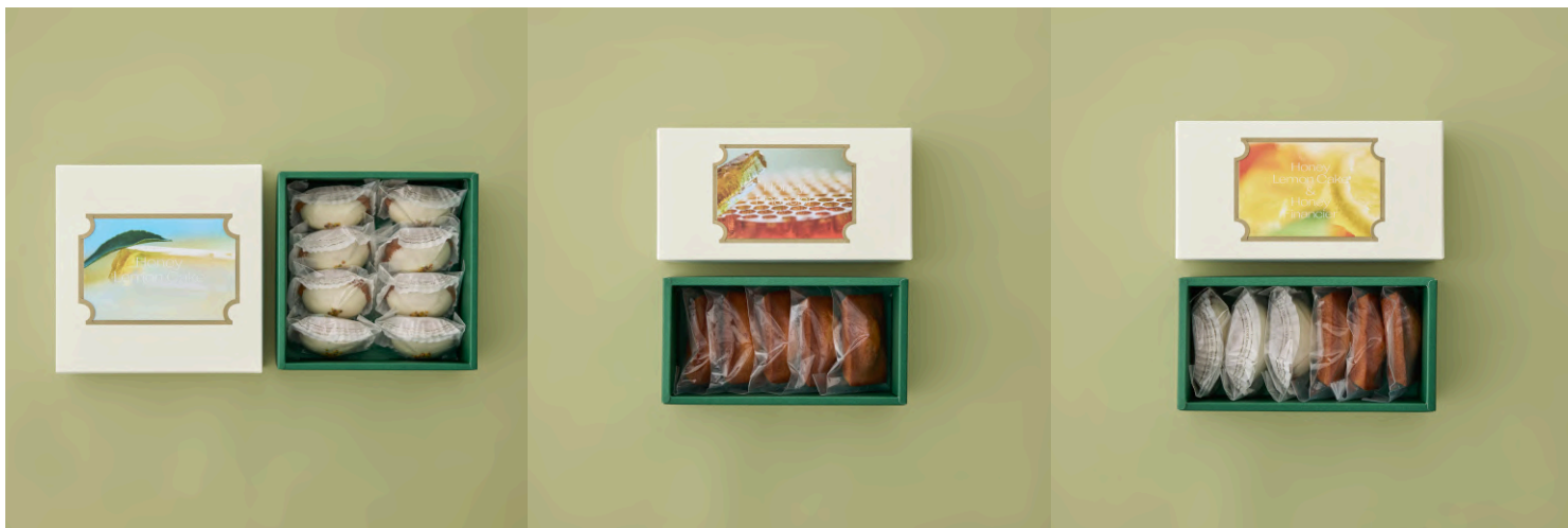
はちみつレモンケーキ 8個入り ¥3,990 (送料込)