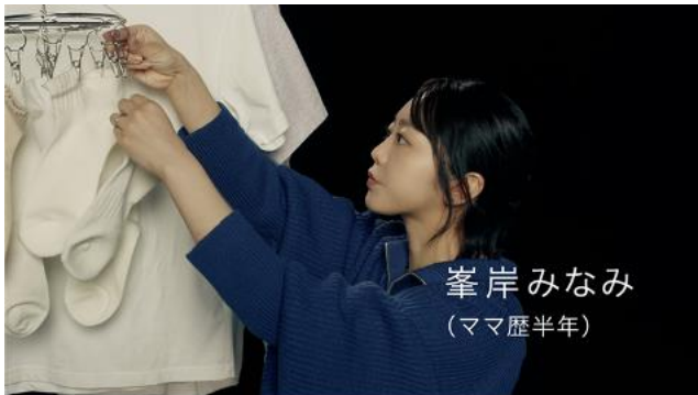
峯岸みなみ (ママ歴半年)

*1 BCAA(Branched Chain Amino Acid): BCAA とは、運動時の筋肉でエネルギー源となる必須アミノ酸である、バリン、ロイシン、イソロイシンの総称です。