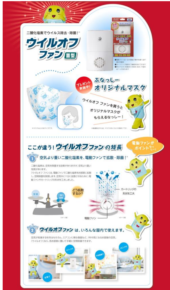
特設 WEB ページ (PC 版)