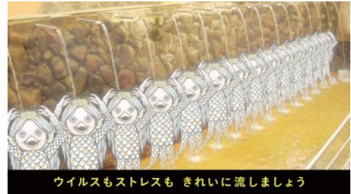
ひょうたん温泉(別府市)