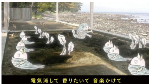
別府海浜砂湯(別府市)