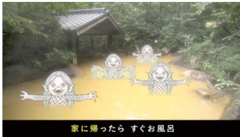
釜の口温泉新清館(九重町)