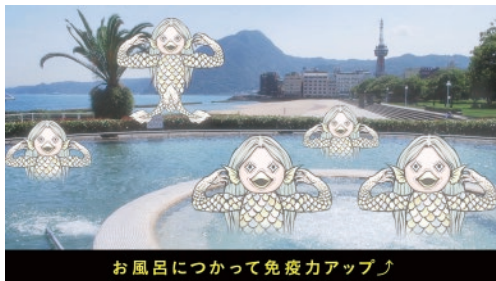
北浜温泉テルマス(別府市)