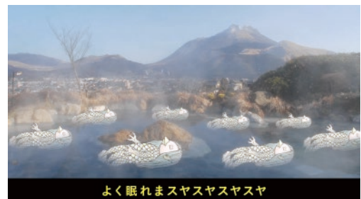
山のホテル夢想園(由布市)