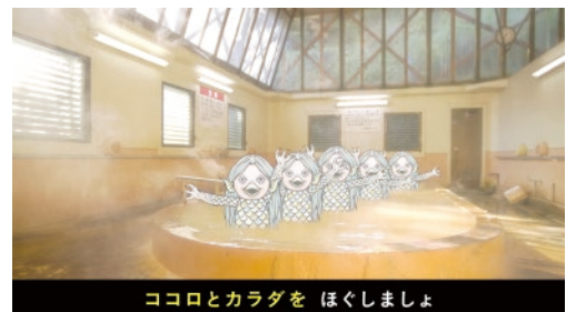
釜の口温泉共同浴場(九重町)