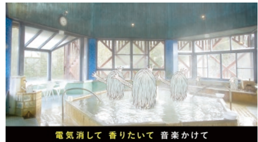
長湯温泉療養文化館 御前湯(竹田市)