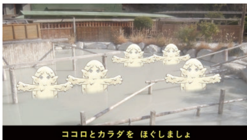
別府温泉保養ランド(別府市)