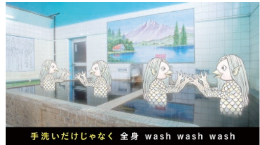
あたま温泉(大分市)