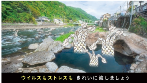
天ヶ瀬温泉(日田市)