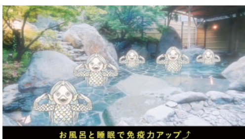
八面山金色温泉(中津市)