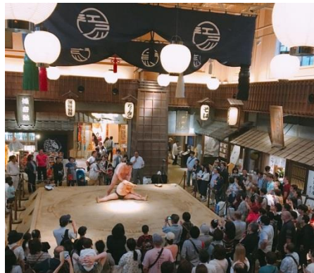
前回の相撲パフォーマンスの様子