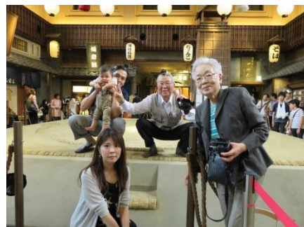
第1回土俵撮影会の様子