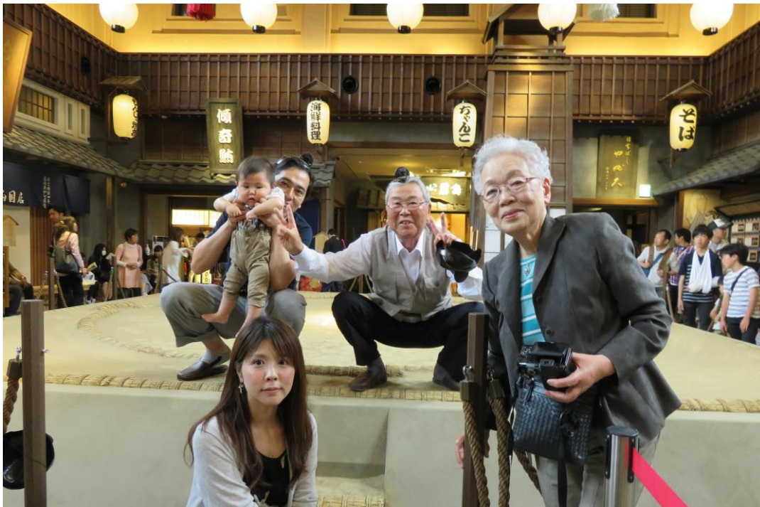
第1回土俵撮影会の様子

こどもの日に合わせ第1回土俵撮影会を開催しましたが、ご好評につき第2回目の開催が決定いたしました！相撲観戦に来た方も、残念ながらチケットが取れなかった方も、-両国- 江戸 NORENで江戸グルメを堪能したあとはぜひお相撲さんになりきって写真を撮りませんか？