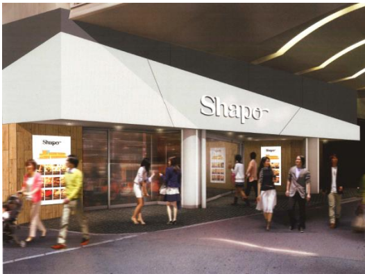
〈千葉側 エントランスイメージ〉

株式会社ジェイアール東日本都市開発が運営するショッピングセンター「シャポ一本八幡」（JR総武線 本八幡駅直結）は、2016年12月8日（木）に第Ⅱ期リニューアルオープンします。