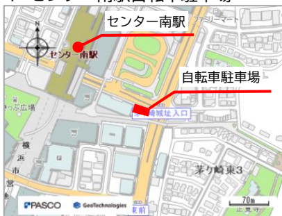
1 センター南駅自転車駐車場