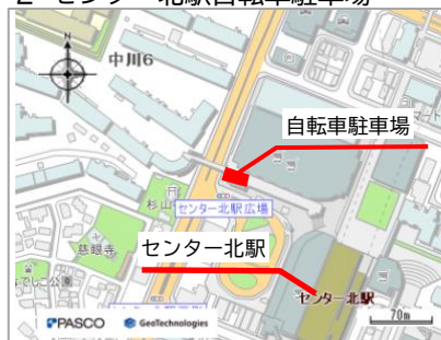
2 センター北駅自転車駐車場