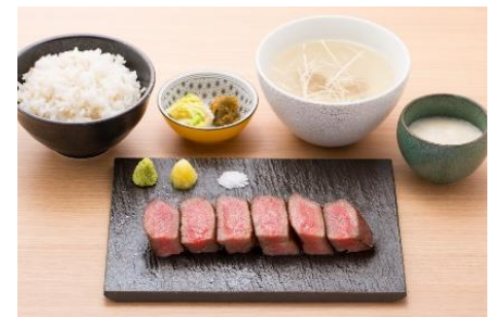
特上たん焼き定食 6切 3,300円(税込)