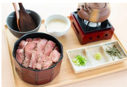
特選牛たん櫃まぶし御膳 3,300円(税込)