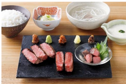
厚切三種盛定食 3,300円(税込)