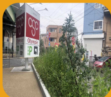
◀Olympicの大きな看板が目印