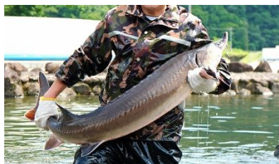
▲チョウザメの養殖