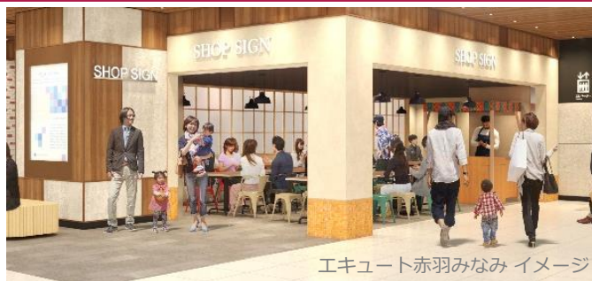
エキュート赤羽みなみ イメージ