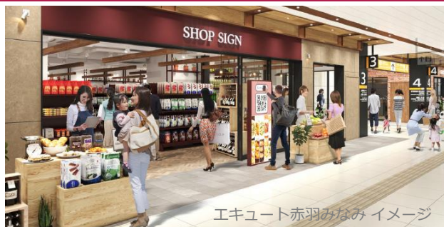
エキュート赤羽みなみ イメージ