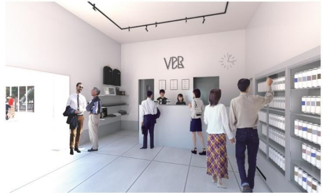
【NEW Bottle Shopイメージ】