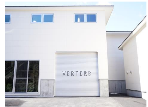
【会場イメージ・アクセス方法】