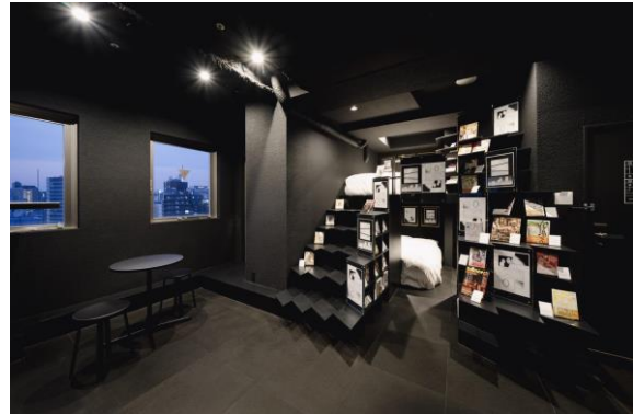
「株式会社dotが運営するMANGA ART HOTELの他施設」