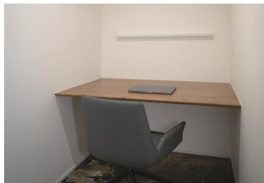
(7Fシェアオフィス個室)