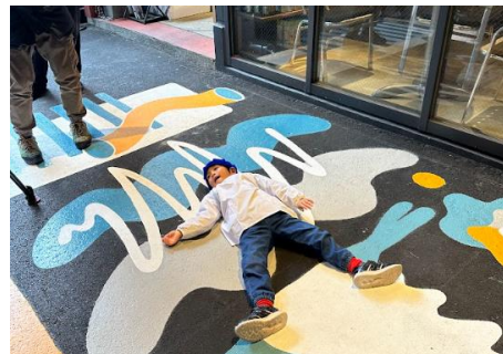
アート製作中風景