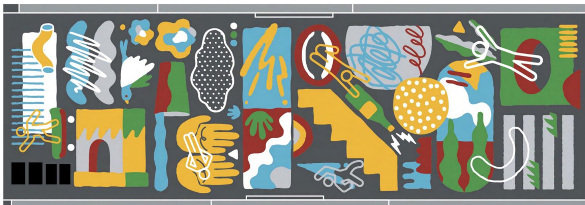
アート完成イメージ図

アート作品には、一般公募で応募いただいた地域住民の皆さまの姿（人型）を背景画に埋め込む手法で制作しています。