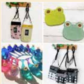
ゆりかご手芸ぼう