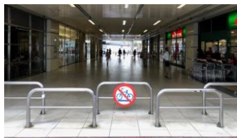
※マルシェ会場（予定）