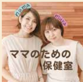
ママのための保健室