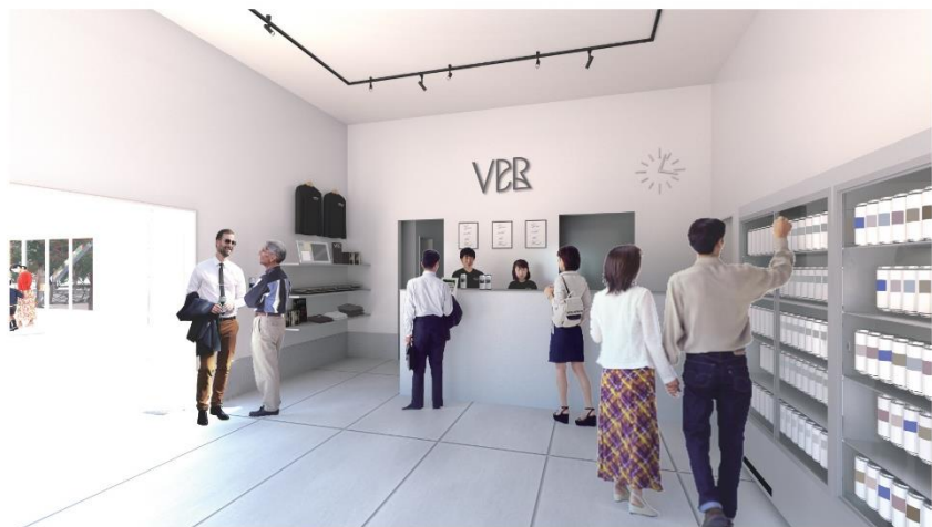
ボトルショップ完成イメージ(2024 年4月)