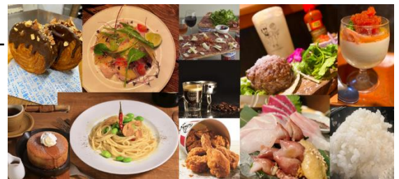
▲ご提供料理イメージ

「ミュージシャン」「芸人」発掘の場を設けた「390 RESTAURANT」や、「アートと地域情報の発信基地」というコンセプトの「タリーズコーヒーコミュニティ」などの高円寺文化を発信するショップが誕生。また、お米にこだわった食事の「米のこじま」、この一杯のために最高の肴をご提供する「この一杯のために」、店舗で焼き上げるパンやケーキとカジュアルフレンチ「パンとビストロ 高円寺FLAT」など、こだわりぬいたショップ7店がオープンいたします。