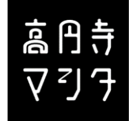
▲施設名称ロゴマーク

旧高円寺ストリート2番街は、高円寺の良さを大切にしながら、南北の通り抜けによる街の回遊の促進、オープンテラスの設置などを実施し、「新しい高円寺らしさ」をコンセプトに生まれ変わります。