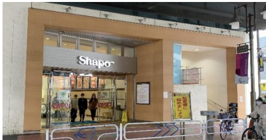
<千葉側エントランス 改装前>

エントランスは、小岩の窯元で制作される陶芸作品『甲和焼（こうわやき）※』のイメージを取り入れたほか、館内にも小岩らしさや風景をモチーフとしたデザインを取り入れます。