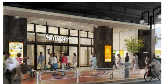
<千葉側エントランス 改装イメージ>

※甲和焼とは：小岩の窯元『甲和焼芝窯（こうわやきれいしょう）』にて制作される、小岩の土を原料にする粘土など用いた焼き物の総称。小岩の地名の元となったと言われている、奈良時代の古い地名「甲和里（こうわり）」から名付けられた。