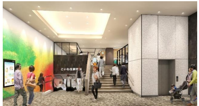
<千葉側エントランスホール>