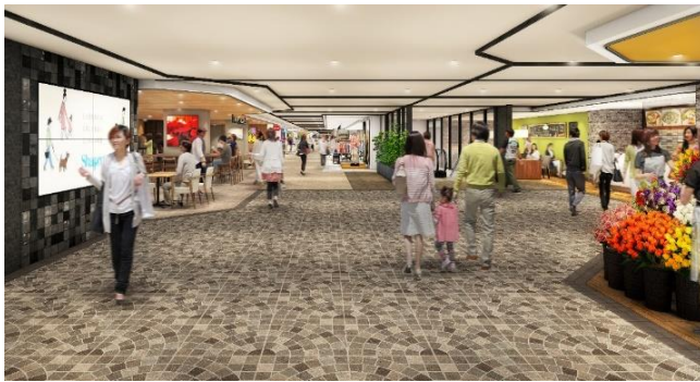
<1階 シャポー改札前>

今回のリニューアルでは、みなさまの毎日に寄り添う約40ショップがオープン。小岩らしい賑やかさや親しみやすさを大切に、これからも地域のみなさまと共に小岩の魅力を高め、小岩の発展に貢献してまいります。