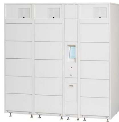
※実際に使用する機器とは外観が若干異なります。

なお、今回の実証実験では、屋内用制御ユニットと冷蔵ロッカーユニットの組み合わせで使用しており、販売商品の保管に適した庫内温度に定温制御を行っています。