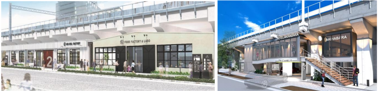
※イメージパースのため実際と異なる場合がございます。施設名称については別途ご報告いたします。