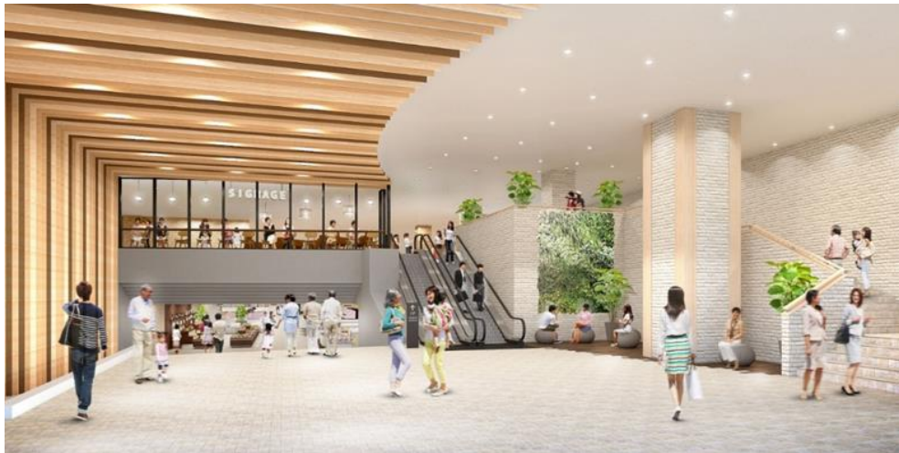
<東側エントランス イメージ>