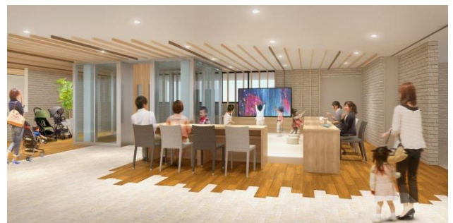
<キッズスペース イメージ>

お子さまが夢中になるような、インタラクティブな遊びができる映像コンテンツをご用意します。保護者の方がお子さまの様子を近くで見ながら、一息つくことができる空間をつくります。授乳室にも、お子さまの好奇心をくすぐるデザインを施します。