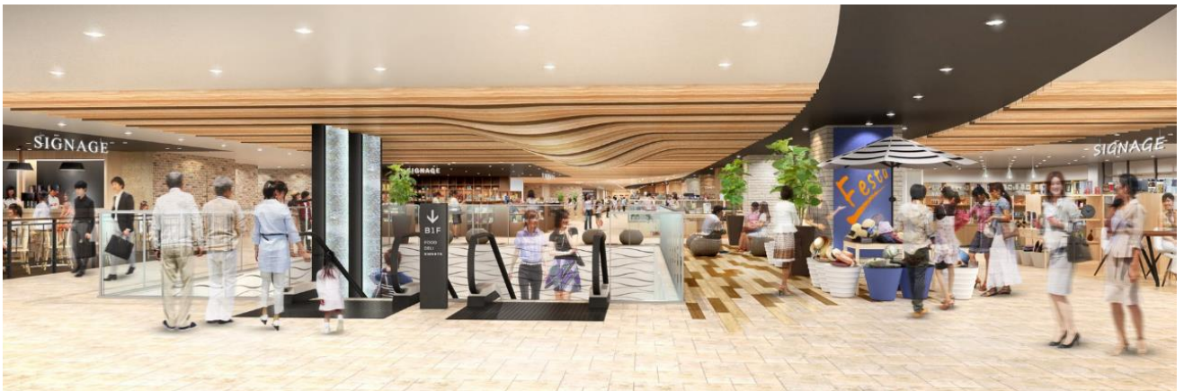
＜シャポ-改札側 エントランスイメージ＞

株式会社ジェイアール東日本都市開発は、ショッピングセンター「シャポ-市川」（JR総武線市川駅直結）を、2019年夏にリニューアルオープンします。皆さまの毎日に寄り添う約80ショップがオープン。利便性を高めるとともに、地域の皆さまにもご活用いただけるコミュニケーションスペースを新設します。これからも地域の皆さまと共に市川の魅力を高め、市川の発展に貢献していきます。