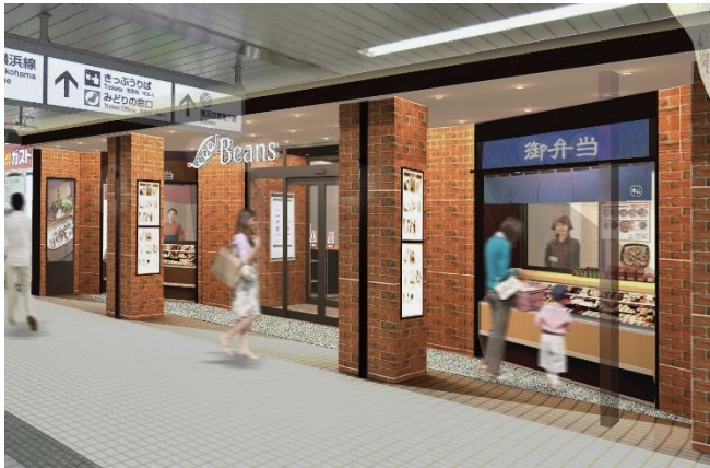
<2階：エントランスイメージ>

株式会社ジェイアール東日本都市開発は、運営するショッピングセンター「ビーンズ中山」（JR横浜線 中山駅直結）を、2019年2月23日（土）にリニューアルオープンします。スターバックスやMUJI comなど、毎日の生活に寄り添う12ショップが2階・3階にオープン。駅をご利用のお客さまや地域の皆さまへ、より便利で快適な暮らしをご提供いたします。