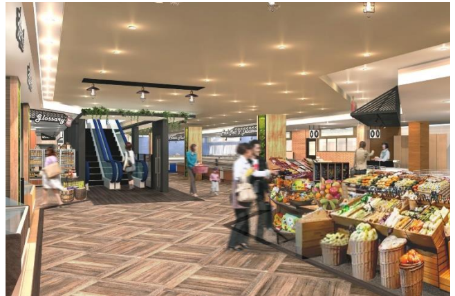
<2階：食料品フロアイメージ>