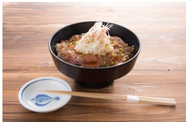
鹿児島産かんぱちと築地魚のあつめし (かぶきまぐろ)