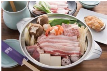
鹿児島産 特選黒豚ちゃんこ鍋 (ちゃんこ霧島)