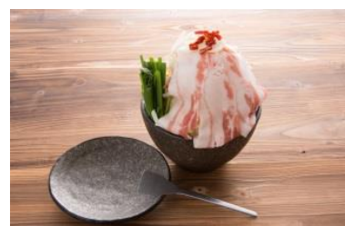
黒豚辛味噌もんじゃ (月島もんじゃもへじ)