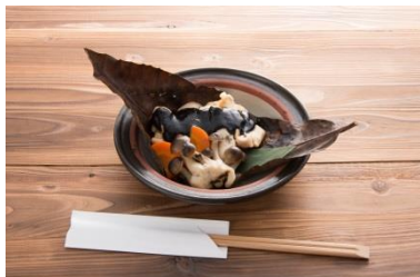
黒さつま鶏純米粕漬 黒ほう葉味噌焼き (門前茶屋 成る口)