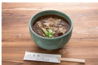
黒豚カレー南ばん (日本ばし やぶ久)