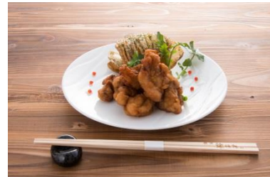
黒さつま鶏の唐揚げ ジャバラポテト添え (根津 鶏はな)