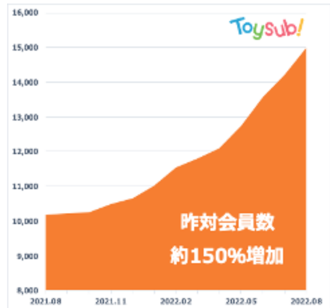
▲「トイサブ！」会員数の推移

コロナ禍でうち時間が増えたことや各種サブスクサービスが生活に浸透したことも影響し、2022年8月時点で、 トイサブ！の利用者数は前年同月比で約1.5倍に成長し、15,000人を突破 しました。