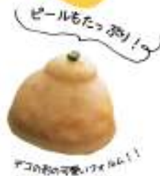
ピールもたっぷり！

MAISON GIVREE江森シェフ 2015年にミラノで開催したアイスワッフルとチョコレートワールドカップにて日本代表キャプテンとして、チームを優勝に導き、今やメディアをはじめ各方面で活躍されている。