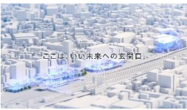
レーション) ここは、いい未来へ の玄関口。 TAKANAWA GATEWAY CITY。 まだ準備中