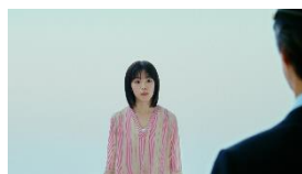
当真さん) どこへ繋がっている のですか、このゲート ウェイは