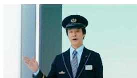
堤さん) これはですね、 門ではないのです