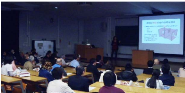
▲昨年度のコズミックカフェの様子