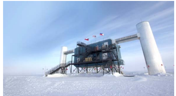
▲南極にあるIceCubeプロジェクト観測所