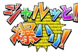
公開収録を行う番組 (協力：千葉トヨペット株式会社)