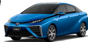
展示する水素自動車