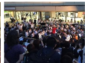
エコステージでの演奏