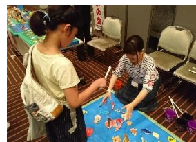
こども向けのエコ体験教室