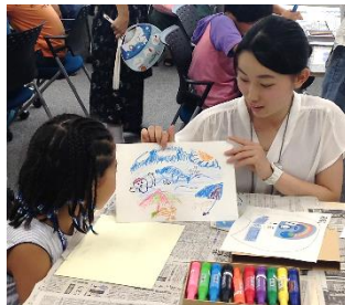
オリジナルうちわづくり