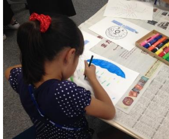
オリジナルうちわづくり